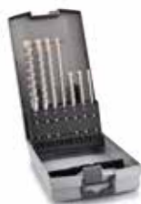
7-delig FCH boorset 783391

Met ons brede assortiment boor-breekhamer accessoires bent u klaar voor de meest uiteenlopende toepassingen. Met de juiste accessoires zoals onze boor en beitelse sets, kroonboren en slangboren, haalt u het meeste uit elke machine.